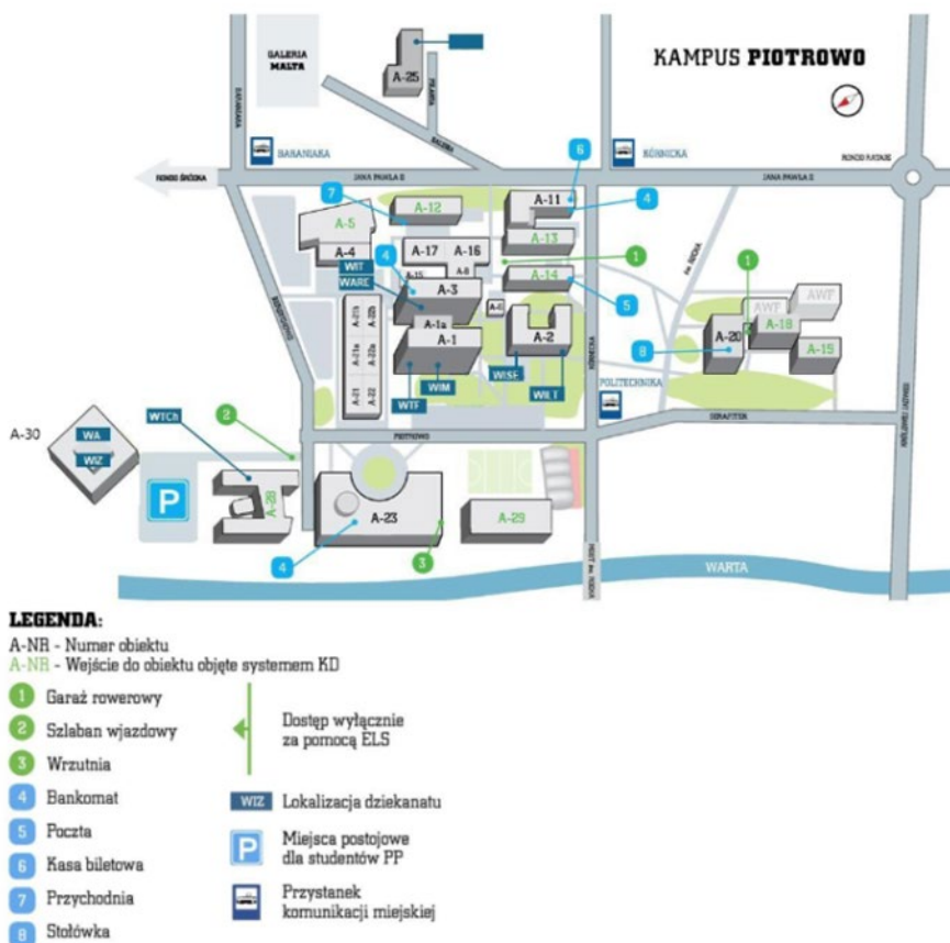
Rysunek 5.1.1. Mapa Kampusu Piotrowo na Politechnice Poznańskiej

Infrastruktura i zasoby edukacyjne wykorzystywane w realizacji programów studiów na kierunku logistyka obejmują infrastrukturę dydaktyczną, naukową, informatyczną, wyposażenie techniczne pomieszczeń, środki i pomoce dydaktyczne, zasoby biblioteczne, informacyjne, edukacyjne oraz aparaturę badawczą. Mapę Kampusu Piotrowo na Politechnice Poznańskiej przedstawiono na rysunku 5.1.1.